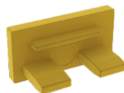
OP2-ZASL-7X14-ZL-02 Zaślepka do LINE MINI, kolor złoty 5908293403261

End cap 7x14mm for LINE MINI / Endkappe 7x14mm für LINE MINI